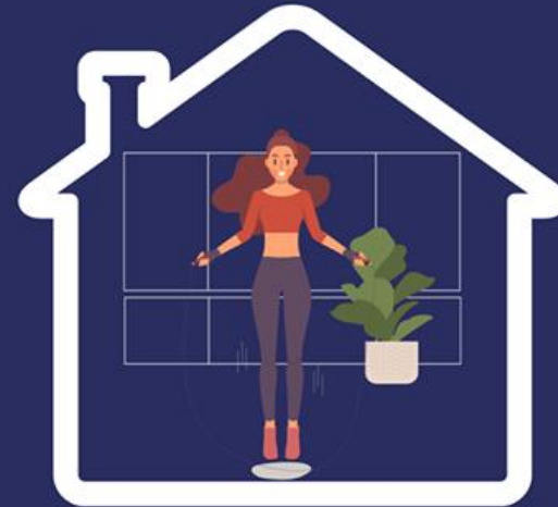
Halo ezersisíu husi uma