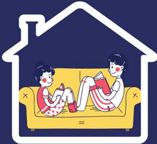
Estuda husi uma