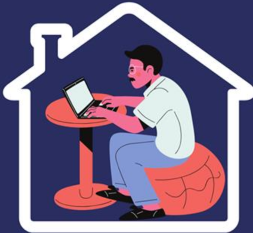
Servisu husi uma